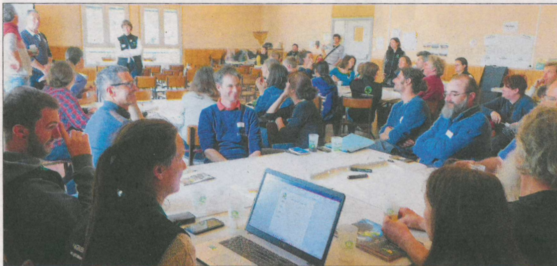
Par groupes, les adhérents ont réfléchi à la stratégie de la structure pour les cinq prochaines années.

À l'issue des échanges, peu d'engagements politiques ont été pris mais des orientations ont néanmoins été définies. Pour la "bio locale et cohérente", l'idée est d'amplifier le travail syndical pour développer davantage l'agriculture biologique sur le territoire. Un guide sur les pratiques de la filière à destination du grand public est d'ailleurs en préparation. Par ailleurs, Agrobio Périgord entend promouvoir son propre label "Bio Cohérence"